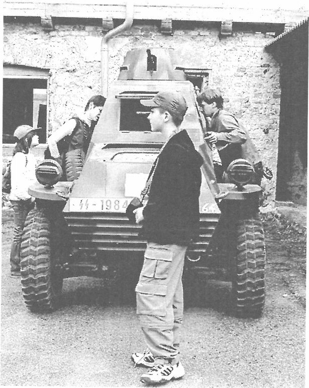
Výstava bojových vozidel při akci "Máj na Manském dvoře".

Práce je před naší partou ještě mnoho. Naší radostí je, když se nám něco podaří. A samozřejmě i to, když ji někdo ocení. Na Manském dvoře usilujeme o vytvoření souladu mezi lidskou činností a přírodou. Chcete-li užívat výsledků naší práce nebo i přispívat ke splnění tohoto cíle, jste u nás vždy vítáni.